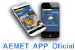
AEMET APP Oficial

El portal de Datos Abiertos de AEMET se enmarca en el Real Decreto 1495/2011, de 24 de octubre, por el que se crea un punto de acceso específico donde poder informar de forma estructurada y usable la documentación actualizada susceptible de ser reutilizada, los formatos en que esté disponible y las condiciones de su reutilización.