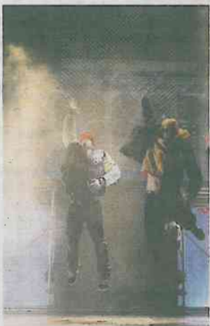
Brodas, hoy en Cartagena.

Japón, Barcelona o Brasil son algunos de los lugares que han disfrutado de este show , el primero de hip hop de gran formato que se hace en España.