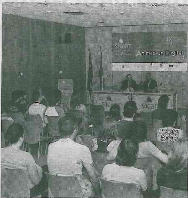
Las jornadas ofrecen una amplia temática.